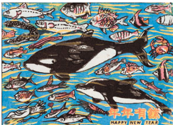
潘元石 木刻水印 年年有餘

三、年畫是中國特有的傳統民俗藝術，早年台灣的版印年畫，採用木刻套色水印傳統雕版印刷技法，近年來，因印刷技術的發展，採用新式平版印刷。年畫喜愛以歡樂吉祥為主題，該年的生肖圖畫更是不可少，請說說看以下的版畫作品包含哪些元素和其引申的意義。